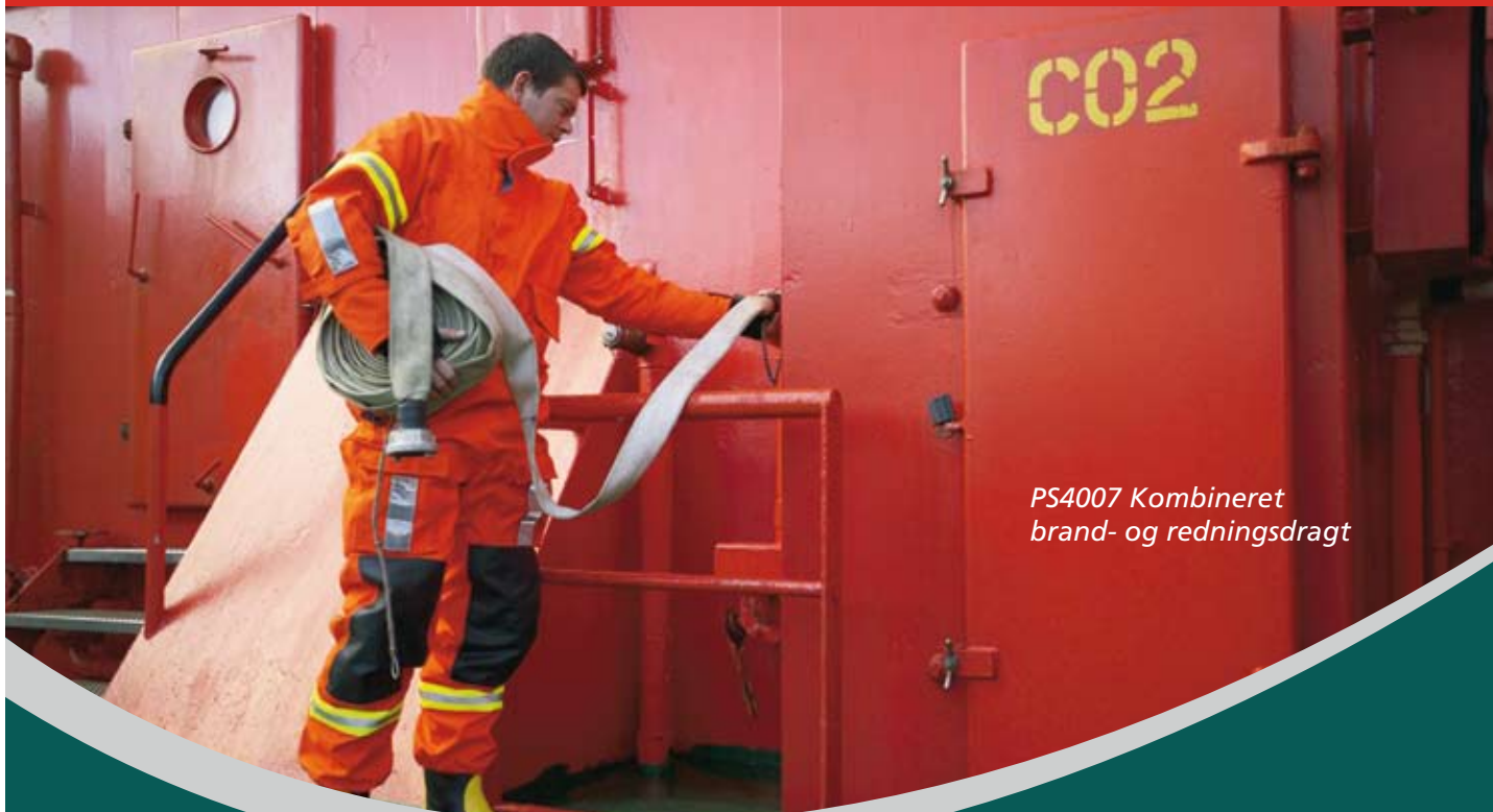
PS4007 Kombineret brand- og redningsdragt